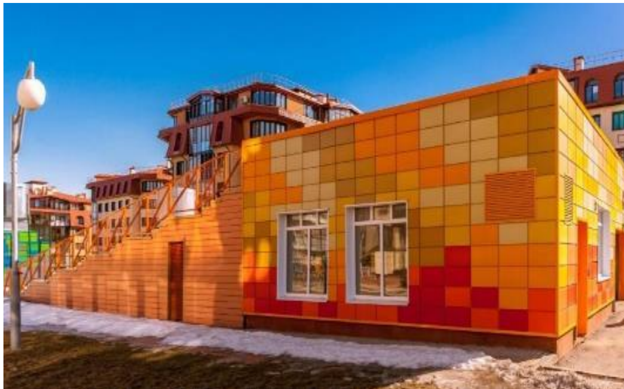
Подземный паркинг жилого комплекса «УРКвартал Кунцево»