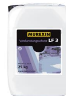
Защитная пропитка LF 3

Упрочнитель для повышения прочности и износостойкости бетонных полов и стяжек, испытывающих средние и высокие механические нагрузки.