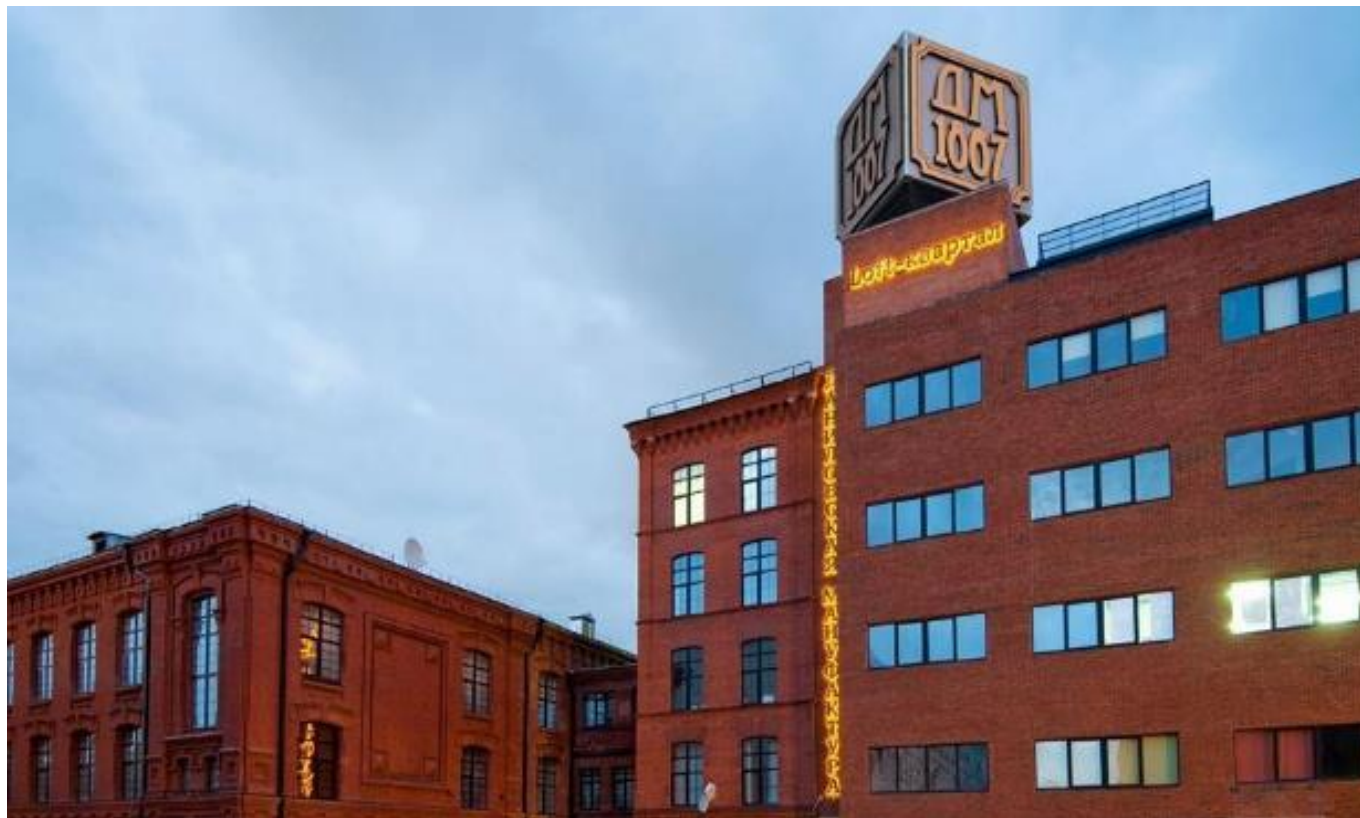
Даниловская Мануфактура Варшавское шоссе