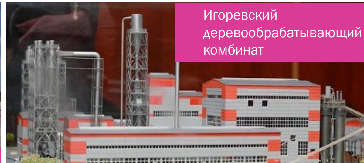
Игоревский деревообрабатывающий комбинат