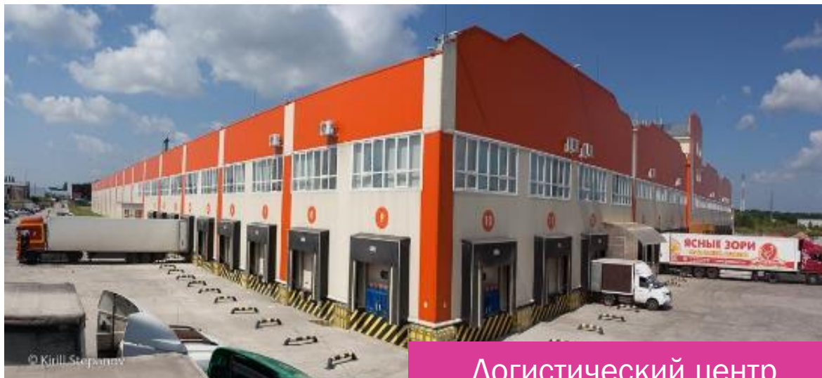
Логистический центр г. Курск