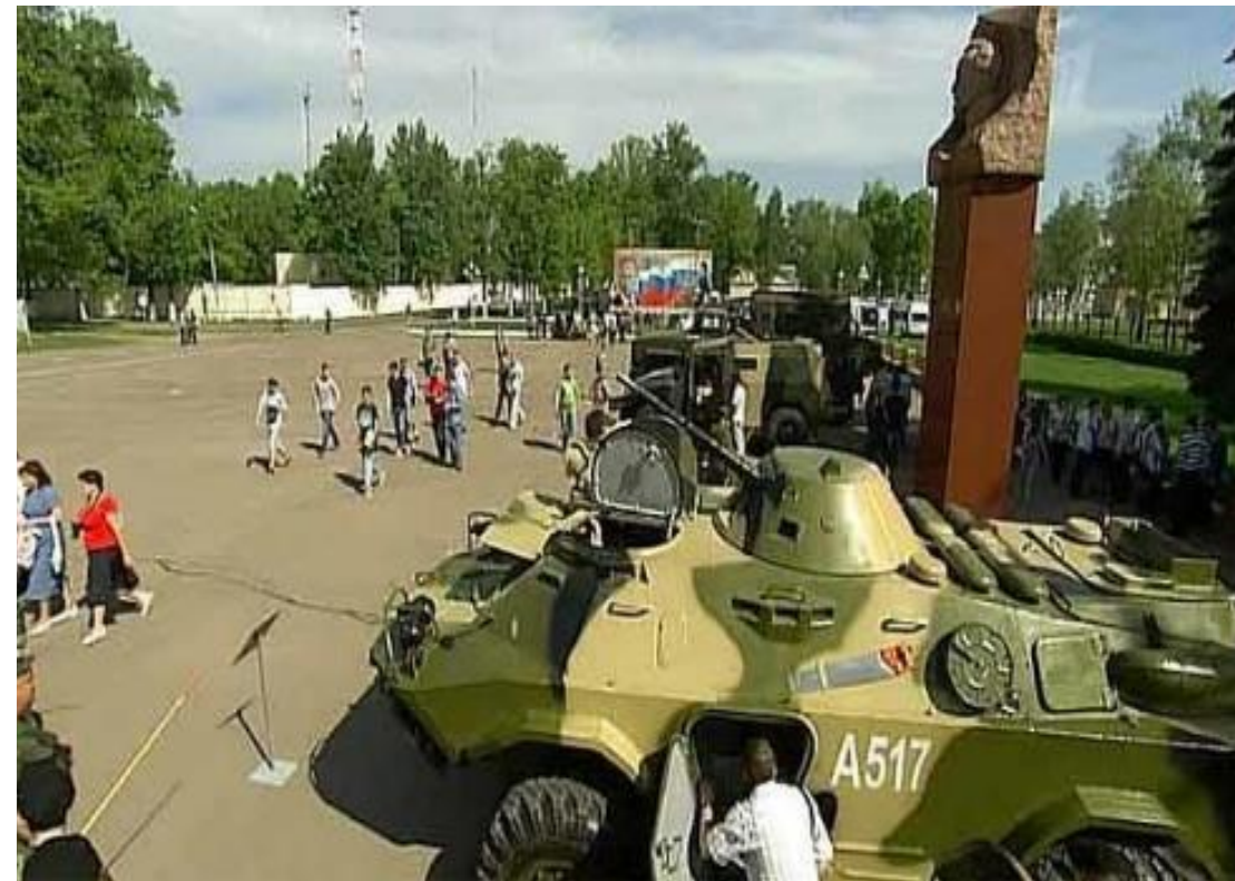
Дивизия Дзержинского г. Балашиха