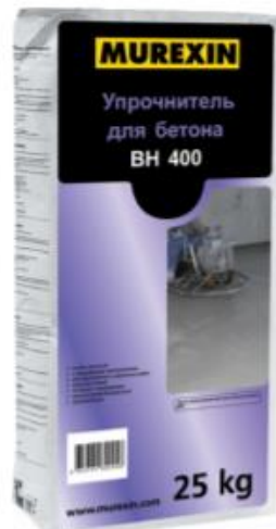
Bodenhärter BH 400 Топпинг с корундовым наполнителем