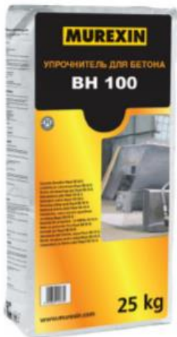
Bodenhärter BH 100 Топпинг с кварцевым наполнителем